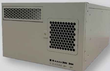
ウォールマウントタイプ SYS-VD301-Q670-BTO