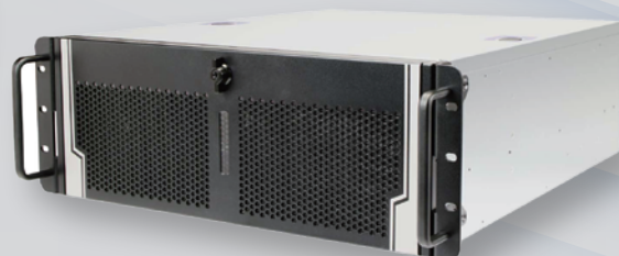
4U ラックマウントタイプ SYS-R400N-Q670-BTO