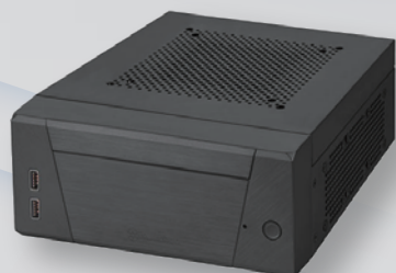
小型デスクトップタイプ SYS-ML10B-ALND1-BTO